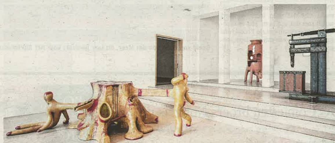
Sommige kunstenaars geven met hun toekomstscenario's kritiek, anderen gebruiken humor.

nen hebben, krijgen ze reacties van misselijkheid.'