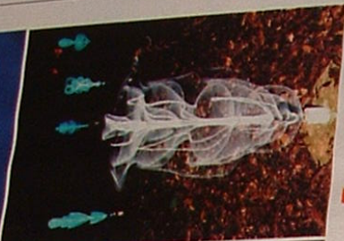
VISOKA TEHNOLOGIJA u prirodnom okruženju (desno)