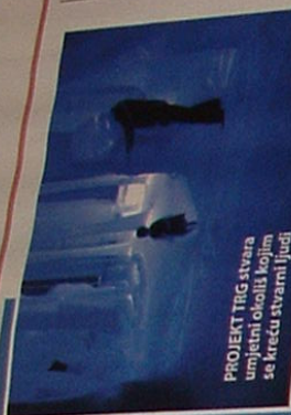
PROJEKT TRG stvara umjetni okoliš kojim se kreću stvarni ljudi