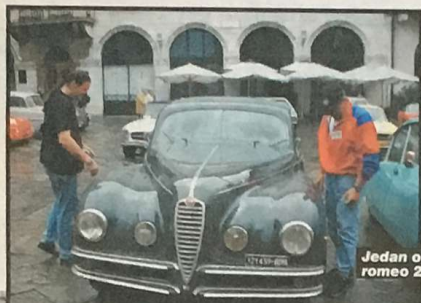
Jedan od najatraktivnijih - »alfa romeo 2500 6 C« iz 1949. godine