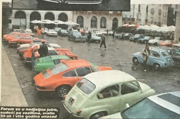
Forum se u nedjeljno jutro, sudeći po vozilima, vratio 30-ak i više godina unazad